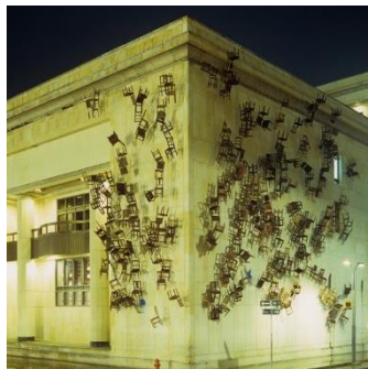
Doris Salcedo, Noviembre 6 y 7 , 2002. Two hundred eighty wooden chairs and rope, Dimensions variable. Ephemeral public project, Palace of Justice, Bogotá, 2002. © Doris Salcedo.

En el 17º aniversario de la matanza del Palacio de Justicia de Bogotá, Salcedo colgó 280 sillas vacías del techo representando cada una de las vidas perdidas.