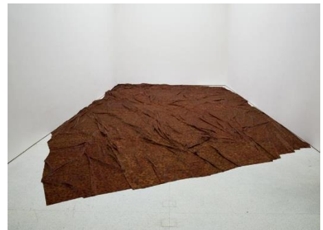
Doris Salcedo, A Flor de Piel , 2012. Rose petals and thread, 257 x 42 ¼ in. (652.8 x 1070 cm). Installation: Doris Salcedo, Solomon R. Guggenheim Museum, New York, June 26 – October 12, 2015.

Salcedo unió pétalos de rosa tratados, en honor a la vida de una enfermera que murió después de proporcionar asistencia a los heridos a ambos lados de la guerra civil de Colombia.