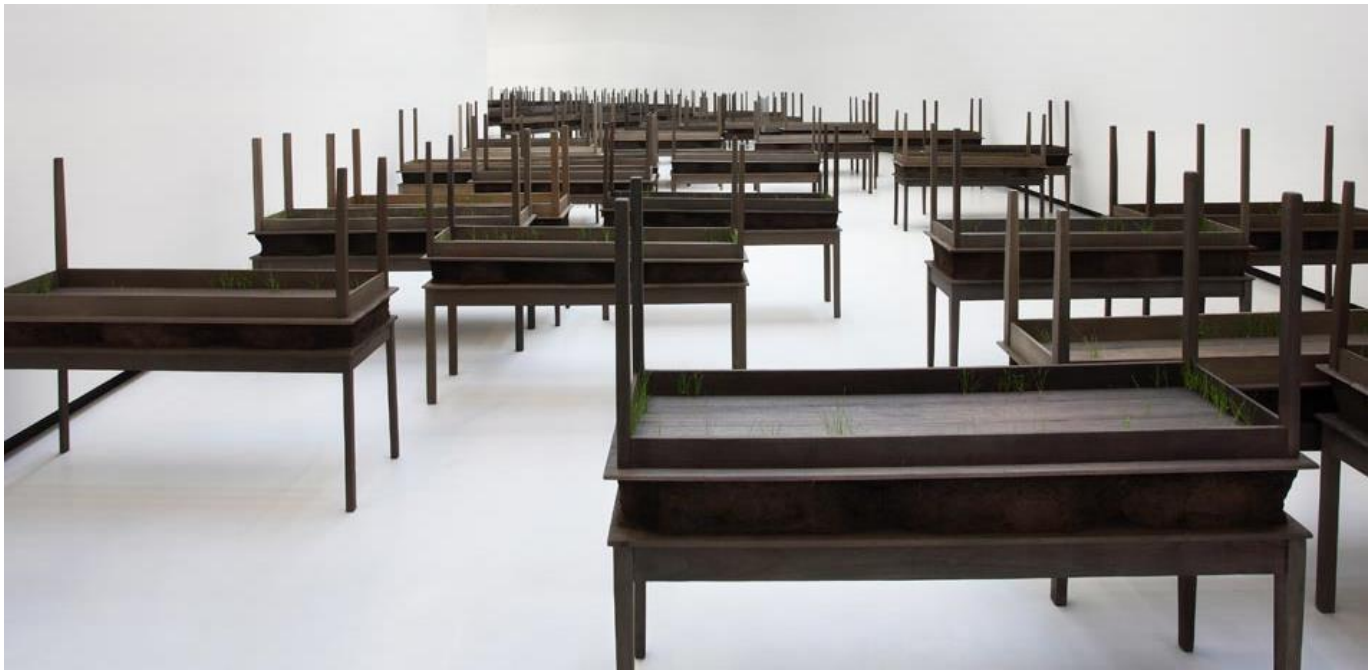
Doris Salcedo, Plegaria Muda , 2008-10. Wood, mineral compound, metal, and grass. Installation: Museo nazionale delle arte delle XXI secolo (MAXXI), Rome, March 15 – June 24, 2012. © Doris Salcedo.