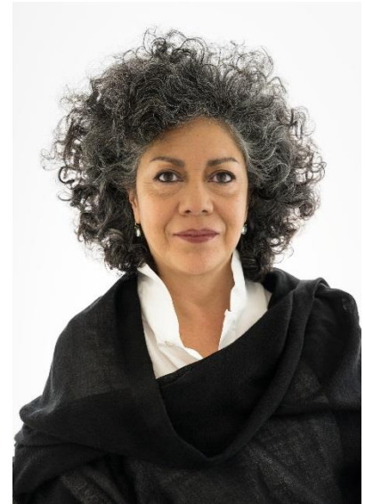
Doris Salcedo.

Salcedo conmemora la vida de las mujeres víctimas de la violencia, usando los zapatos de las mujeres, colgados detrás de una capa de piel unida a un animal escondido.